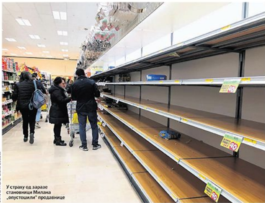
У страху од заразе становници Милана „опустошили“ продавнице