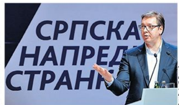
АЛЕКСАНДАР ВУЧИЋ НА ГЛАВНОМ ОДБОРУ СНС-а

Шта представља „Ахтисаријевог план плус плус“? То сада нико поуздано не може да зна, осим што се спекулише да би он могао да донесе додатне гаранције за Србе у покрајини да ће њихова права бити поштована. Неки медији претпостављају да би тај документ представљао најширу могућу аутономију за север Косова, нећу од оне предвиђене