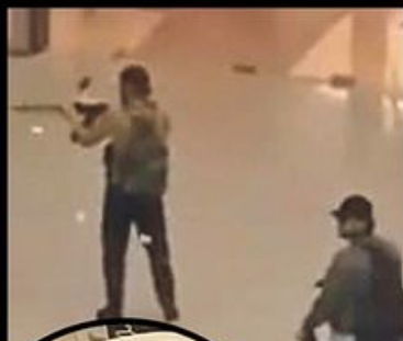
Monstrumi uhapšeni prilikom pokušaja bekstva u Ukrajinu

>>> JEZIV EPILOG: Oko 150 mrtvih, preko 100 ranjenih. Strahuje se da bi konačan broj žrtava mogao da bude i veći >>> Tadžikistan demantuje umešanost svojih državljana u nezapamćen teror