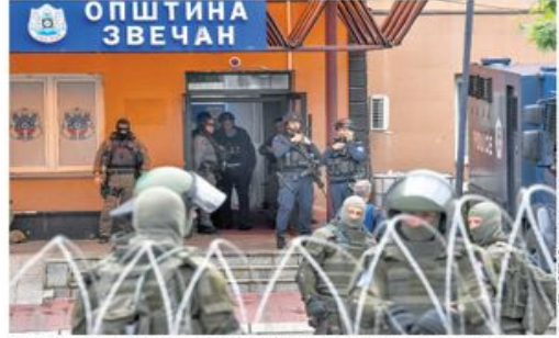
Косовска полиција и КФОР испред зграде Општине Звечан, 31. мај 2023.