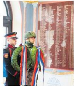
Учесница имена и прозивана 1.139 припадника Војске Србије и МУП-а

на страдале у НАТО агресији 1999. године, а пре тога је посетио фабрику „Борбени сложени системи“ у Пљавоку код Куршумлије, у којој се производе оклопна борбена возила „лазар“ и „милош“. Он је рекао да му орамо да повећаморачуна о себи и јачамо војску и одбрамбене капацитете земље. „Смислено је да је време изазова у геополитичким амбиенту пред нама. Хоћемо ли умети да се поставимо на најбољи могући начин и да у тим изазовима временом овукамо и мир и вољу, али и земљу, као и да одржимо своје потенцијалне агресоара? То је велико и важно питање за нас“, истакао је Вучић, а пренео Танјуг. Нагласио је да у сваком случају и ашу којој орамо да наставимо да јачамо и наше одбрамбене капацитете да снажимо. „Морамо да појачамо у неким фабрикама и бољим корпоративним менаџмент. Морамо да радимо још много више и још много да доживимо“, истакао је председник. страница 4