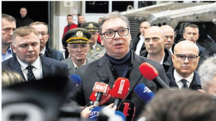
Председник Србије у фабрици „Борбени сложени системи“ у Пљавоку, која производи борбена возила „лазар“ и „милош“

Председник Србије Александар Вучић поручио је поводом 25 година од почетка НАТО агресије на Српску да, иако је Србија жива и пробудна, она је и даље пркосна и слободна и да од побуне никада неће моћи да јој узму. Вучић је на иновативном и модерном „Борбени сложени системи“ подсетио да су 24. марта 1999. године 19 некроносних и најчистијих напада Србију безбедносног права и права пута без одлуке Савета безбедности Уједињених нација. Умислао је су нам земљу 78 дана. Убијали децу. Командни територије. Храбрија. Пркосна. И више од свега, слободна. Слободна је више од ваздуха, слободна никада неће моћи да нам узму. Живеће Србија“, навео је Вучић. Председник је синоћ присуствовао у Пројектлу централној мисији стацији поводом обележавања Дана сећања