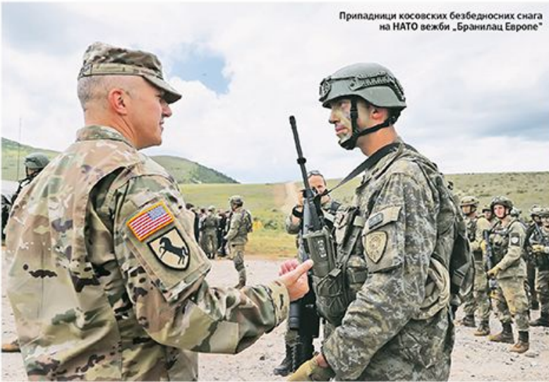
Припадници косовских безбедносних снага на НАТО вежби „Бранилац Европе“