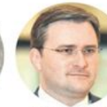
Никола Селаковић Министарство спољних послова