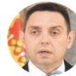
Александар Вулин Министарство унутрашњих послова