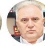
Ратко Димитровић Министарство за бригу о породици и демографију