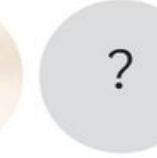
Министарство просвете, науке и технолошког развоја