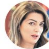
Татјана Матић Министарство трговине, туризма и телекомуникација