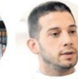
Вања Удовићић Министарство омладине и спорта