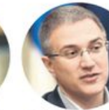
Небојша Стефановић Министарство одбране