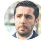
Томислав Момировић Министарство грађевинарства, саобраћаја и инфраструктуре