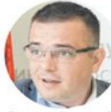
Бранислав Недимовић Министарство пољопривреде, шумарства и водопривреде