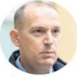
Златибор Лончар Министарство здравља