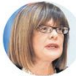
Маја Гојковић Министарство културе и информисања