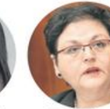
Гордана Чомић Министарство за људска и мањинска права и друштвени дијалог