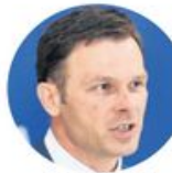
Синиша Мали Министарство финансија