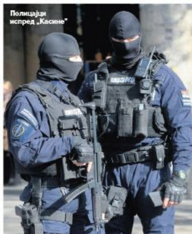
Полицијци испред „Касине“

Након три сата детаљног претреса „Касине“, полиција је напустила локал. страни 10