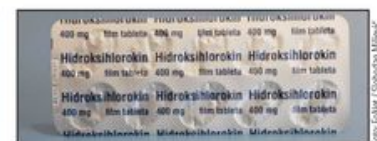
Svetska zdravstvena organizacija obustavila upotrebu najpoznatijeg leka za koronu koji se koristi i u Srbiji

Moguće da je hlorokin opasan za kovid pacijente