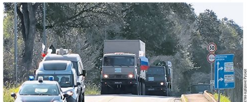
Конвој руских војних возила под праћом италијанске полиције

чега су се западни медији већ питали како је могуће да држава с толиком територијом има тако мали број заражених – уследно је још један изненађујући потез. Русија је на врхунцу здравствене кризе у Италију послала 15 авиона са 100 војних лекара вирусолога и епидемиолога, 600 респиратора, осам медицинских тимова, специјална возила за дезинфекцију и медицински материјал. страна 3