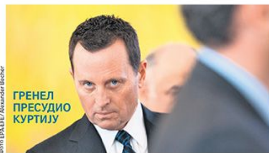
ГРЕНЕЛ ПРЕСУДИО КУРТИЈУ

СПЦ: владике старије од 65 да остану у кућама стр. 8