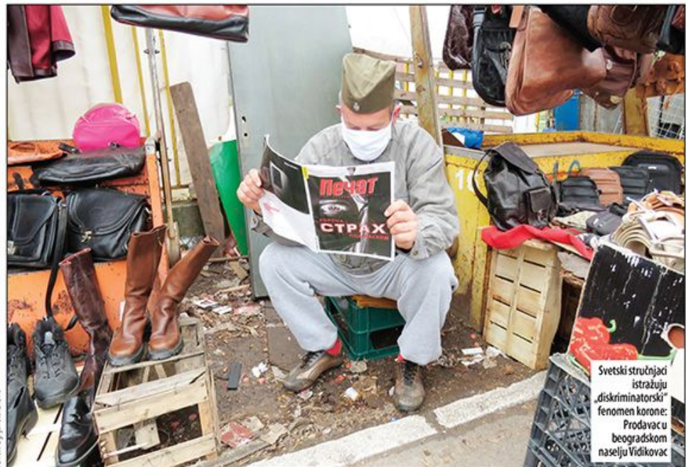
Svetski stručnjaci istražuju "diskriminatorni" fenomen korone: Prodavač u beogradskom naselju Vidikovac

■ U Italiji smrtnost kod osoba muškog pola iznosi 71 odsto, a u Španiji je, prema podacima koji su juče objavljeni, preminulo dvostruko više muškaraca nego žena