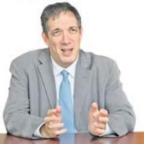
Фото амбасадор Израела

РАЗГОВОР НЕДЕЉЕ: ЈАХЕЛ ВИЛАН, амбасадор Израела у Србији