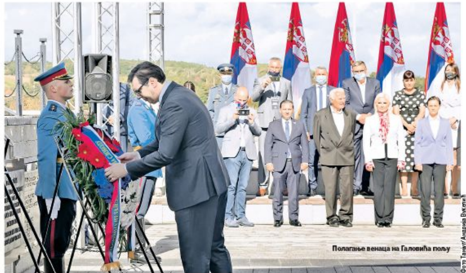
Полагање венаца на Галовића пољу