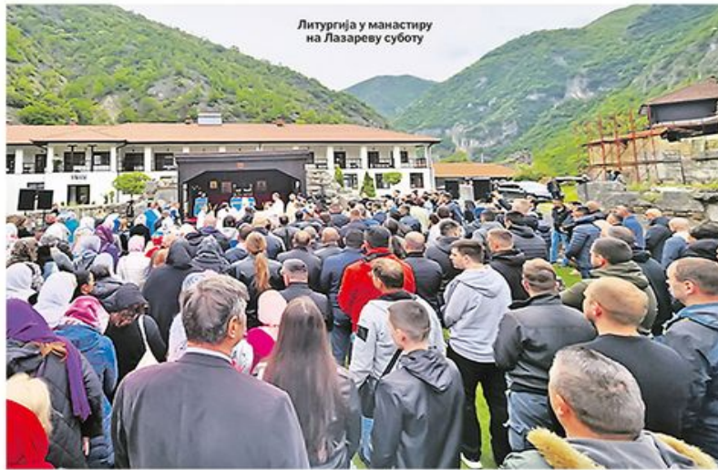
Литургија у манастиру на Лазареву суботу