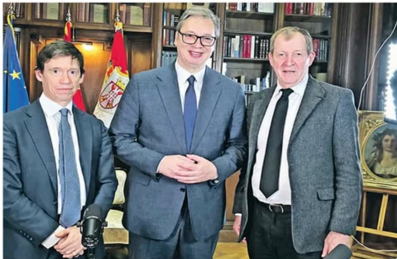
Рори Стјуарт, Александар Вучић и Алистер Кембел

Председник Александар Вучић изјавио је да будућност Србије види у отварању граница на Балкану и с Европом. У интервјуу за подкаст Алистера Кембела „Остало је политика“ на платформи „Епла“, на питање како гледа на 1999. рекао је да су људи веома разочарани оним што је урађено. „Ако питате грађане Србије, осећају још већу огорченост и разочарање због понашања 19 земаља које су покренуле агресију против суверене земље. И људи су апсолутно сигурни да је то учињено без сагласности УН, што је и потврђено Резолуцијом 1244. То није учињено да би се спречила некаква хуманитарна криза, како