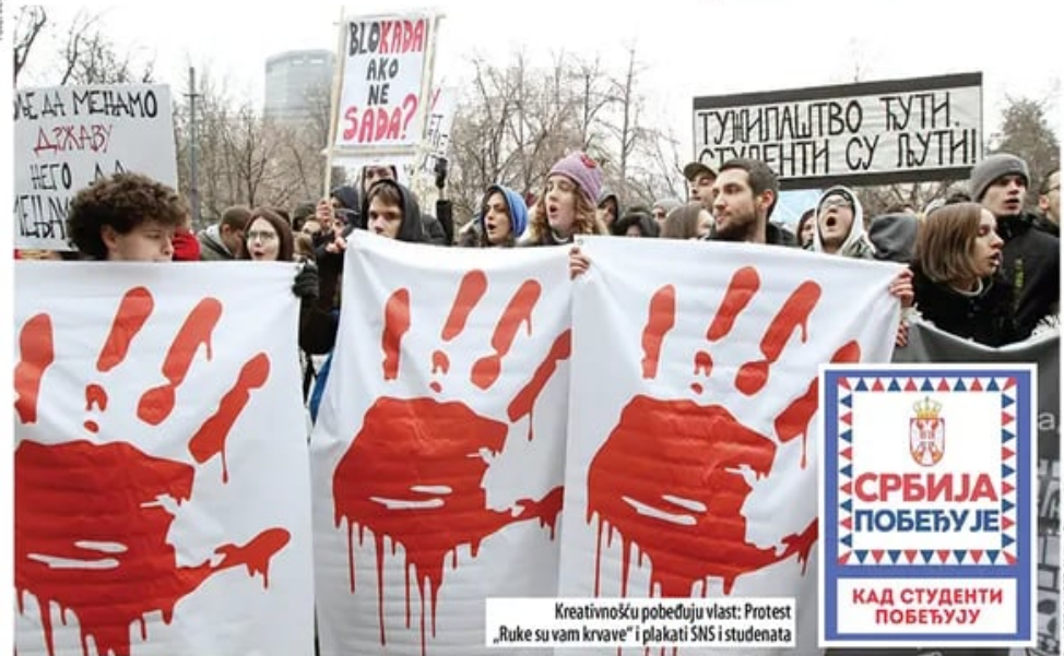
Kreativnošću pobeđuju vlast: Protest „Ruke su vam krvave“ i plakati SNS i studenata