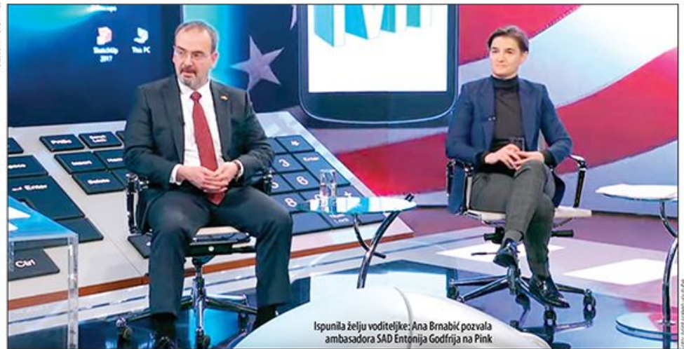
Ispunila želju voditeljke: Ana Brnabić pozvala ambasadora SAD Entonija Godfrija na Pink