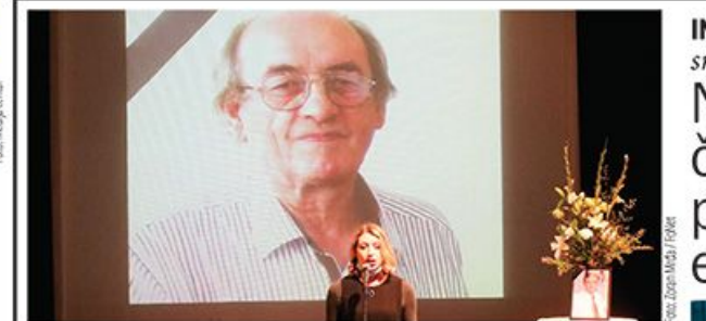
Komemoracija direktoru Danasa održana u Beogradu