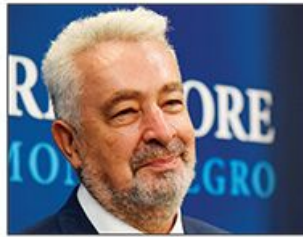
Neizvesnosti oko formiranja vlade u Podgorici