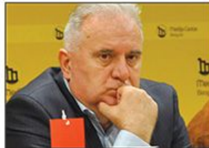
Novi ministar za brigu o porodici na udaru kritika