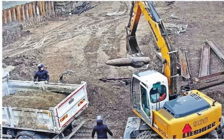
Вађење авио-бомбе НАТО-а на градилишту у нишком насељу Стеван Синђелић