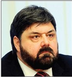
Biznismen Dejan Đorđević sudski goni naš list i traži 500.000 dinara odštete