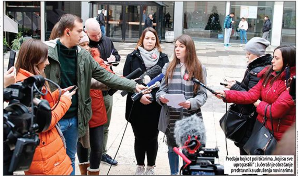
Predaju bojkot političarima „koji su sve upropastili“: Jučerašnje obraćanje predstavnika udruženja novinara