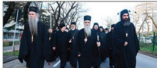
Reagovanje crnogorske vlade na preksinoćne incidente u Podgorici

Premijer i zvanično pozvao mitropolita na dijalog