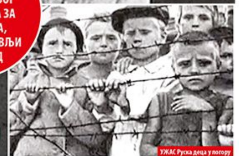
УЖАС Руска деца у логору