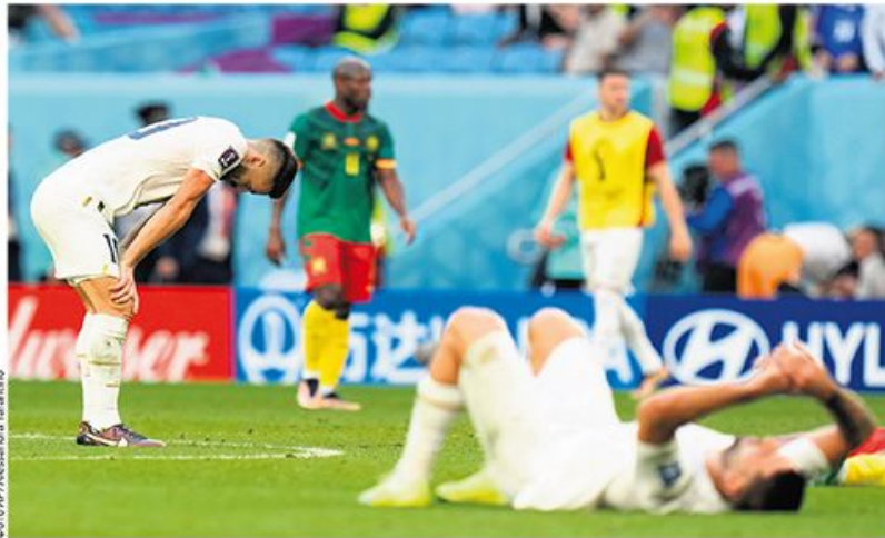
Душан Тадић и Александар Митровић у неверици на крају меча

Нашој репрезентацији два гола предности нису била довољна за победу, лоше реакције на лопте из последње линије и погрешна тактика поставка кумовале ремију – 3:3 (2:1)