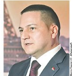
МИНИСТАР БРАНКО РУЖИЋ ЗА „ПОЛИТИКУ“