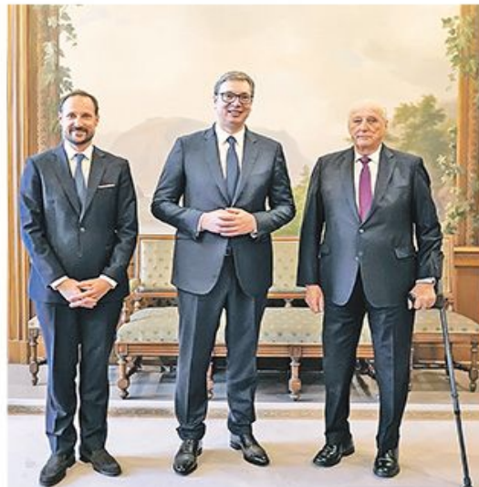
Принц Хокоон, Александар Вучић и краљ Харалд јуче у краљевској палати у Ослу

Председник Србије Александар Вучић, који борави у дводневnoj посети Норвешкој, изјавио је јуче да је са домаћинима разговарао о Косову и Метохији, али приоритетно о билатералним односима. „Разговарали смо о свим важним темама, за нас је питање КиМ од огромног значаја. Говорили смо суштински о томе, јер Норвешка боље, тачније и прецизније од свих дијалогистује стаме на терену, разуме ситуацију и прати све. Они су неко ко чува мир у 20. и 21. веку, по завршетку вишедеценијских сукоба које су имали и то поштују“, рекао је Вучић у изјави новинарима, преноси Таијуг. „Ситуација на северу, што се српског народа тиче, буквално ври... Србија је прекрпело. Прекрпело је свима. Магистрирају, муче људе. Када све саберете, свакитице да је у питању један систематски прогон, људи имају дугу, јаку досаду било“, рекао је председник и додао да се Албин Курти позива на све оно што му одговара, а никако да се придржава онога што је потписано у Бриселу.