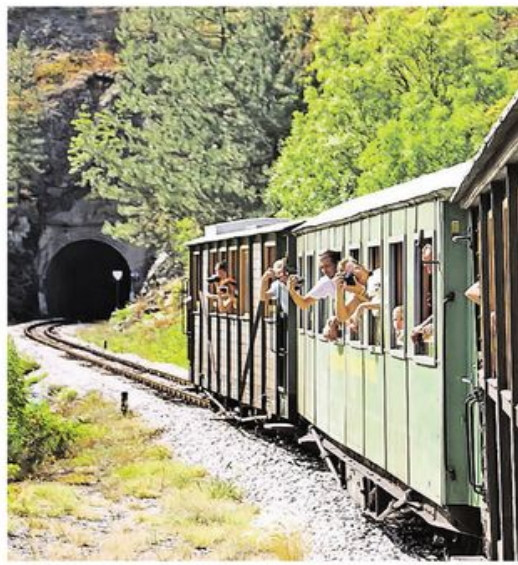
Популарна „Шарганска осмица“ сваке године привлачи велики број путника