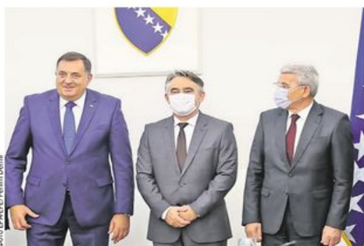
Милорад Додик, Жељко Комшић и Шефик Цаферовић