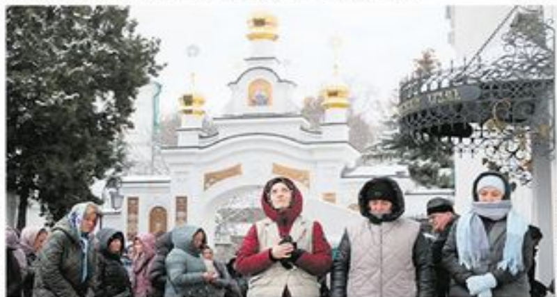
Верници у молитви пред манастиром у којем су поздрављени мошти 140 светиња