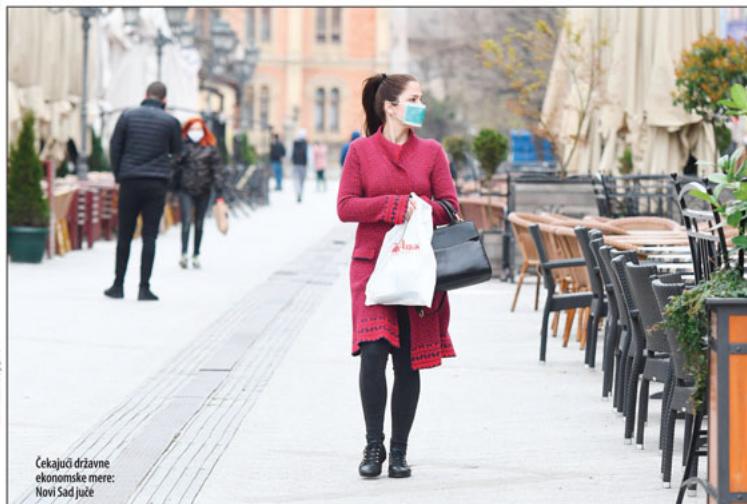
Cekajući državne ekonomske mere: Novi Sad juče

■ Ekonomisti: Mere razumne i uglavnom su ih druge zemlje već donele. Umesto po 100 evra svima, neka novac ide onima koji su ostali bez posla i socijalno ugroženima