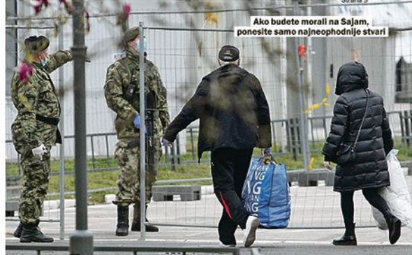
Ako budete morali na Sajam, ponesite samo najneophodnije stvari