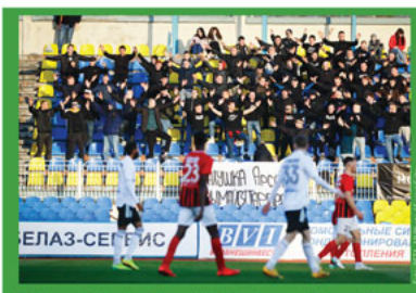
Zašto se fudbal u Evropi jedino igra u Belorusiji