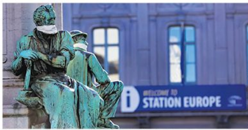
Статуа са маскама испред зграде Европског парламента у Бриселу

„Шенген“ дочекао годишњицу затворених граница, а на самиту лидера ЕУ оживеле старе поделе – Немачка и Холандија не желе да деле терет са Италијом и Шпанијом