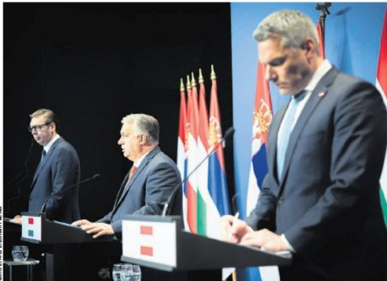
Председник Србије, премијер Мађарске и канцелар Аустрије јуче на скупу у Будимпешти