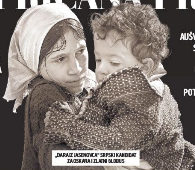
„DARAZ JASENOVCA“ SRPSKI KANDIDAT ZA OSKARA I ZLATNI GLOBUS