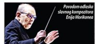
Povodom odlaska slavnog kompozitora Enja Morikonea