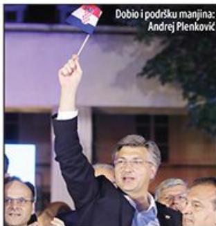
Dobio i podršku manjina: Andrej Plenković

Dan posle pobeđe na izborima u Hrvatskoj