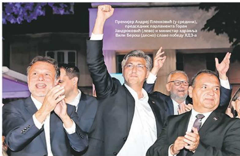
Премијер Андреј Пленковић (у средини), председник парламента Горан Јандрковић (лево) и министар здравља Вили Берш (десно) славе победу ХДЗ-а