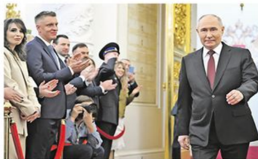
Свечаност у Великој палати Кремља

Владимир Путин јуче је званично започео пети мандат на положају председника Руске Федерације након полагања заклетве у Великој палати Кремља. Он ће на функцији остати наредних шест година, до 2030. године, преноси РИА Новости. Путин је на председничким изборима у Русији, одржаним од 15. до 17. марта, освојио 87,28 одсто гласова.