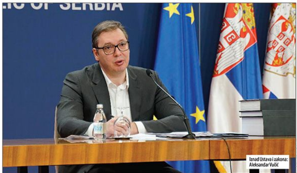
Iznad Ustava i zakona: Aleksandar Vučić