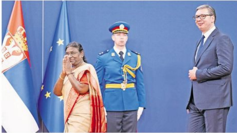
Лидери две државе јуче у Београду