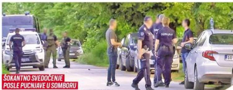
ŠOKANTNO SVEDOČENJE POSLE PUCNJAVE U SOMBORU