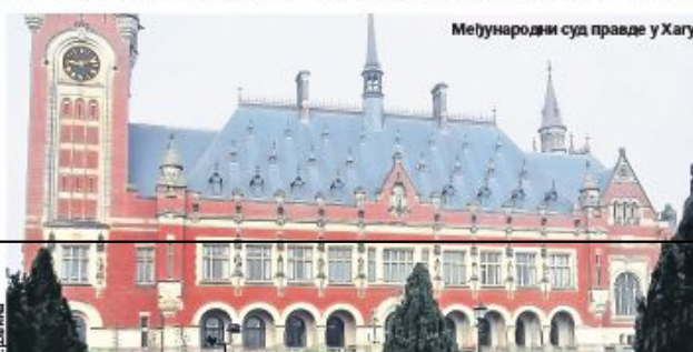
Међународни суд правде у Хагу

Из судског механизма за „Политику“ је одговорено да тај суд не може да коментарише предлоге којима адвокати траже пуштање осуђеника на слободу. Наши саговорници, адвокати са великим искуством у одбрани пред Хашким трибуналом, очекују да однедавно нема места оптимизму када је реч о пуштању на превремену слободу Срба које је осудио трибунал. стр. 8