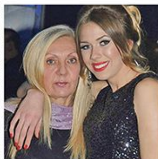
Ispovest Miljanine majke