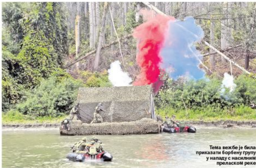
Тема вежбе је била приказати борбену групу у нападу с насилним преласком реке