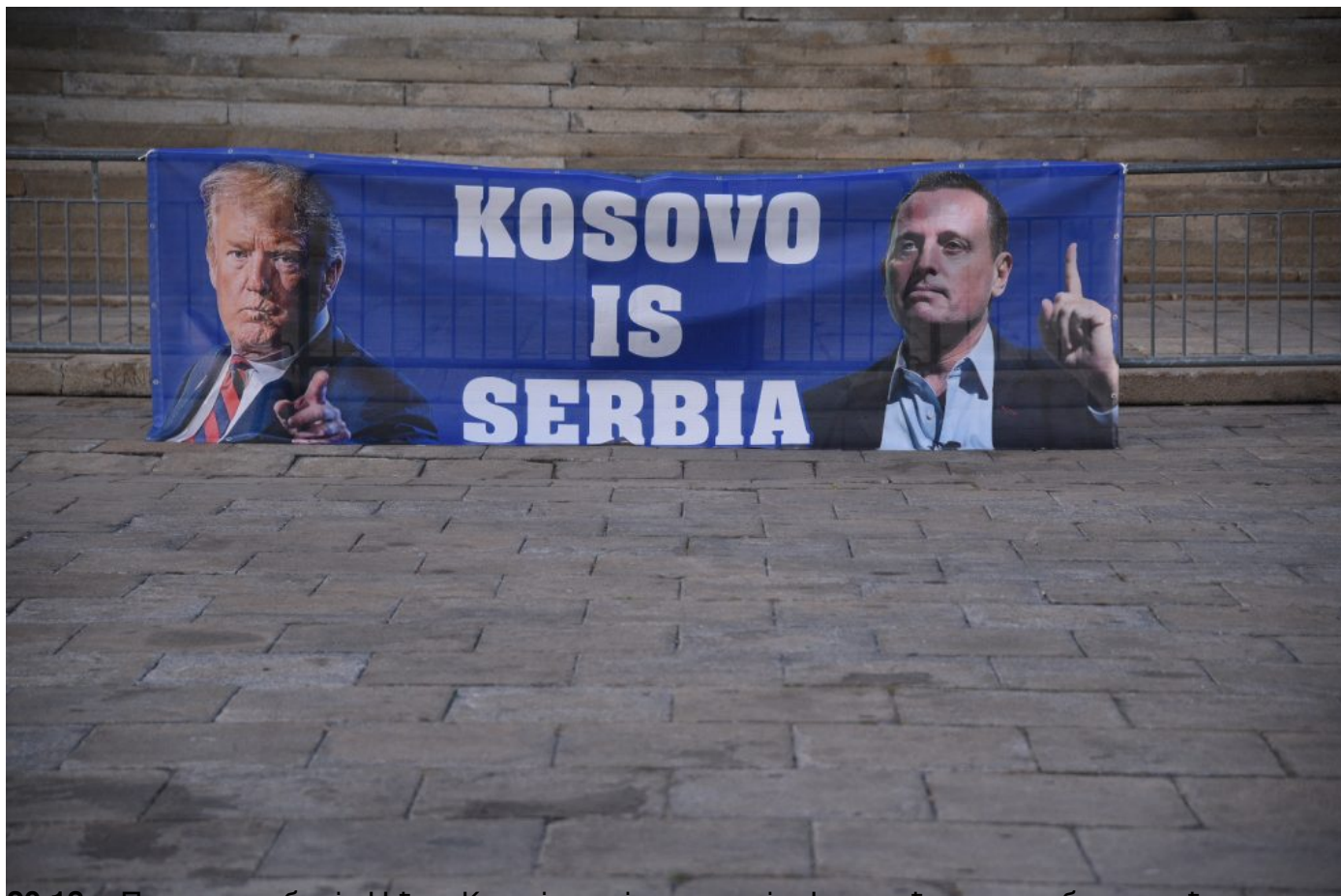
2018. Знајући мали број грађана у Београду, очекује се жандарме и полицијски часничари да се