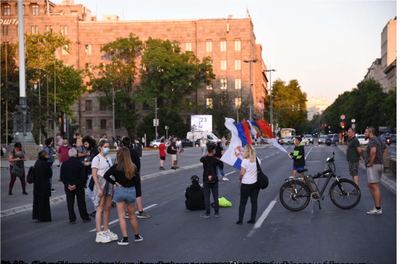
21.08 - Београд, Србија. Напољу су се окупили грађани који подржавају председника Србије, Војислав Давидовић, у вези са Драганом