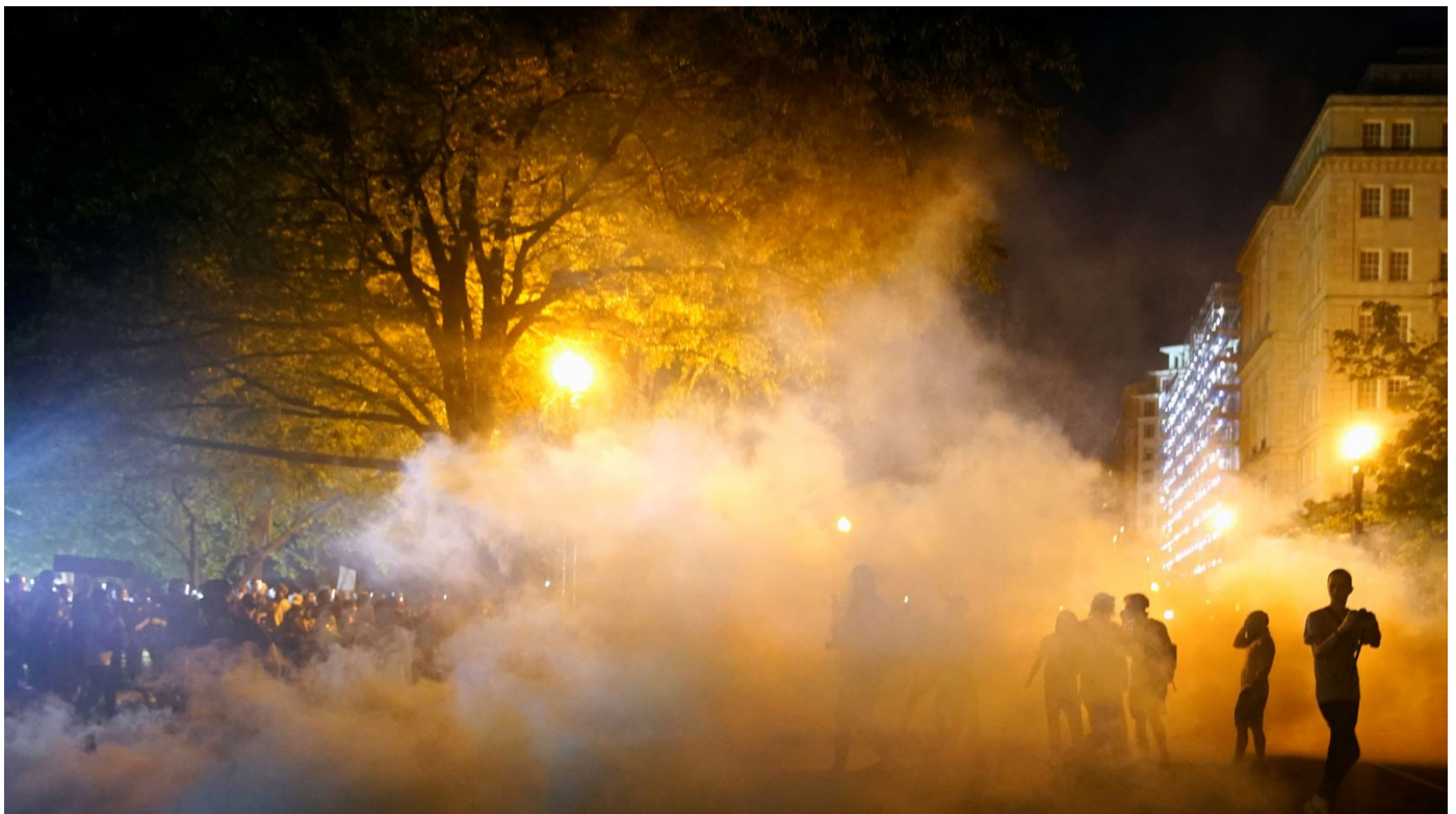
Протести испред Беле куће

Власти у Минеаполису, саопштиле су да су успеле да зауставе насилне протесте у којима су уништени делови града. Полиција и припадници Националне гарде сукобили су се са демонстранцима који су, пети дан за редом, изашли на улице упркос полицијском часу. Група демонстраната кренула је ка центру града када је полиција испалила сузавац и гумене метке. Демонстранти су се одмах разишли.