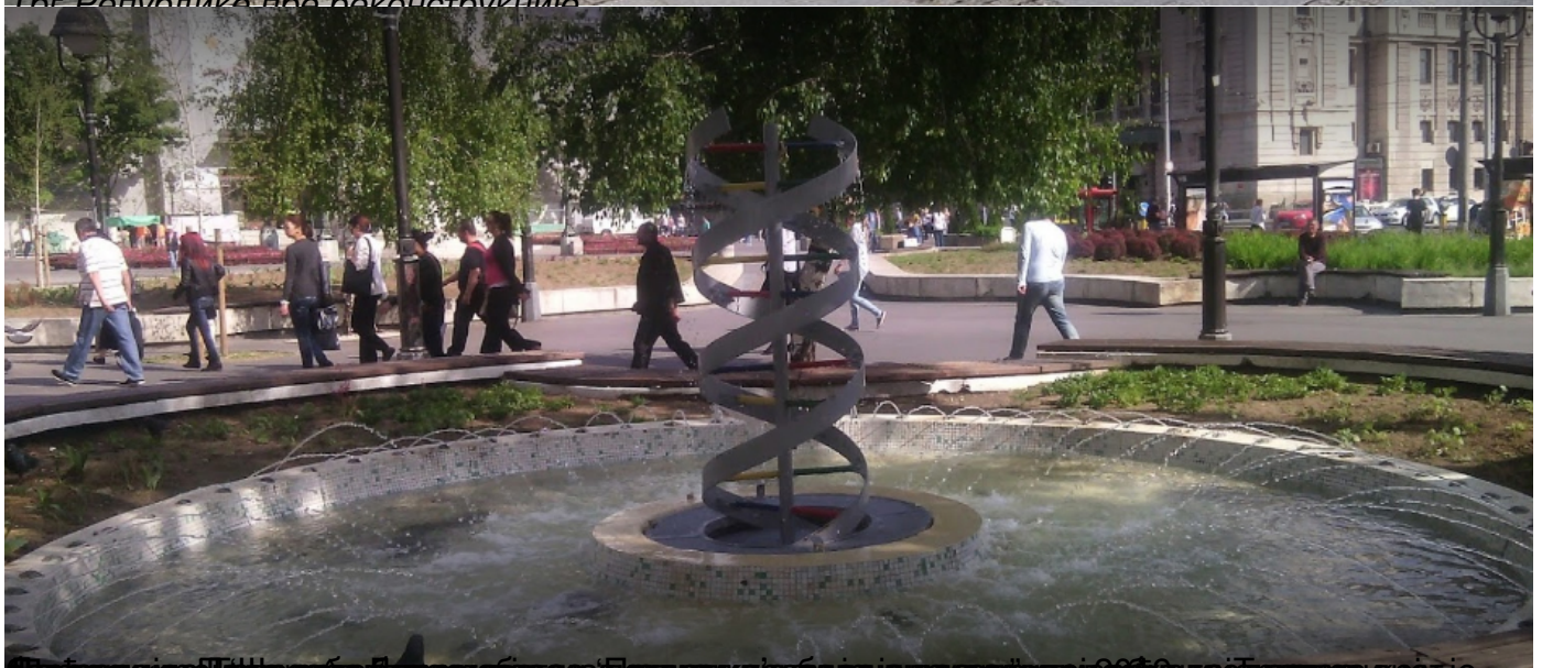
Датум: 10.08.2020. 17:46.