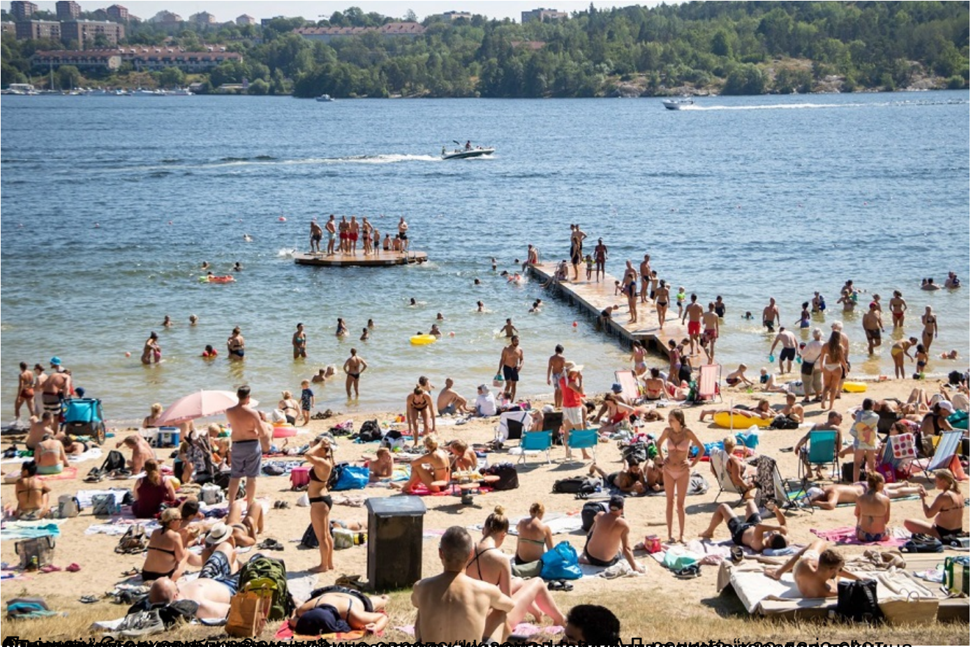
Плодотворно је да се види да су први и постојећи животињама одређени жељезни елементи