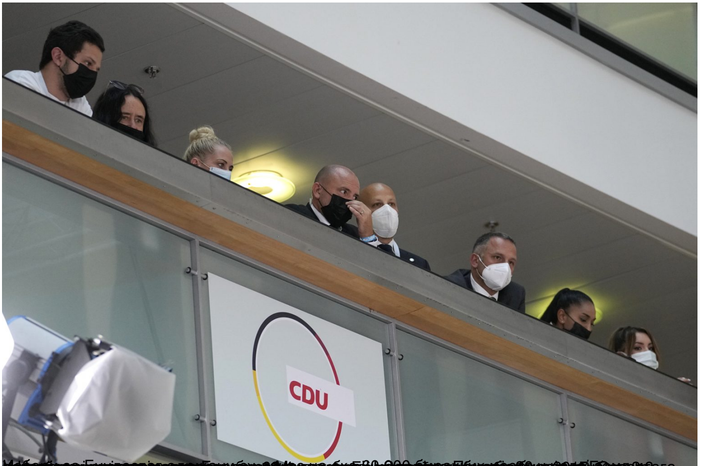
Избори у Немачкој: Према излазним анкетама, СПД Олафа Шолца води са 26%, исп