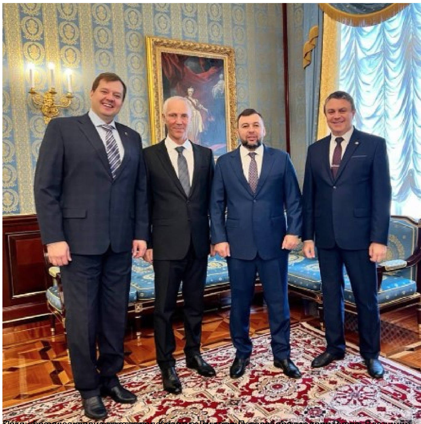
Кључне прасице на јавној свечаној церемонији у Москви, председник Русије Владимир