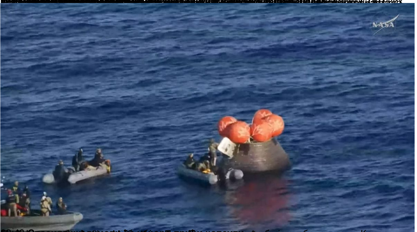
Орион се спушта у воду са бујинских лоптица које га подржавају док се спушта ка броду који га прикупља. Када