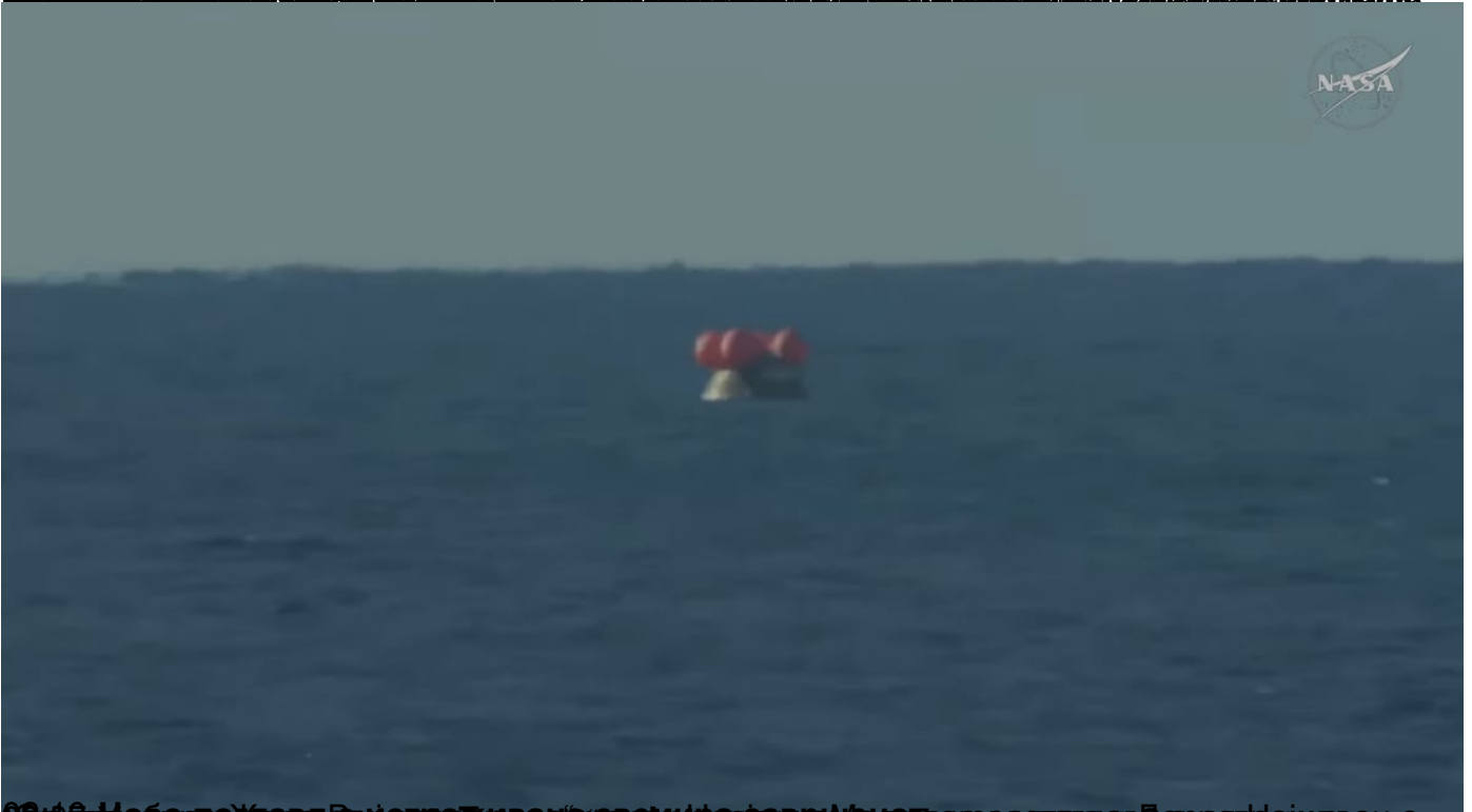
00:16 Небо и Земља Рајини 2006. Успешно слетео у Пацифички океан код Сан Дијега