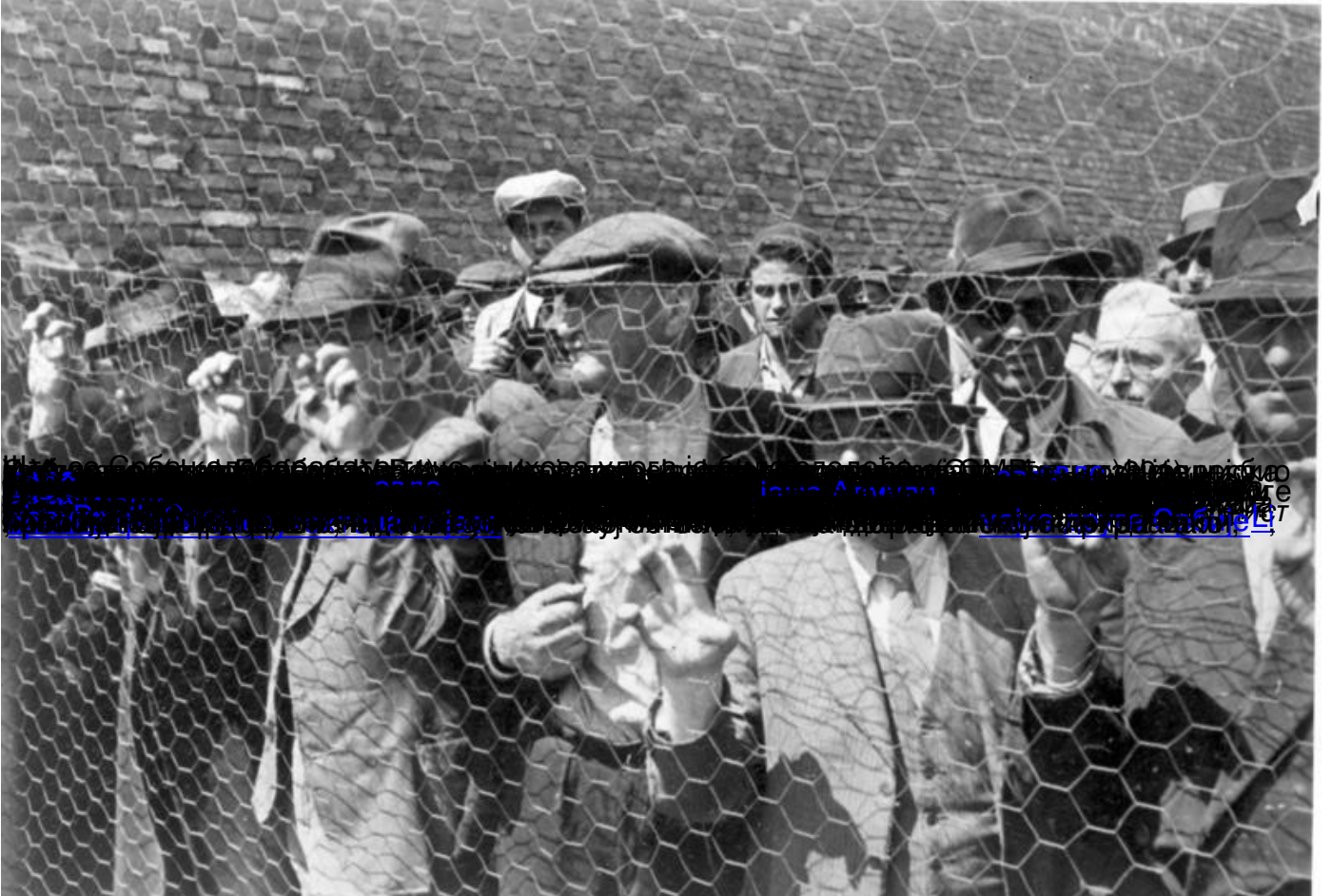
April 1941