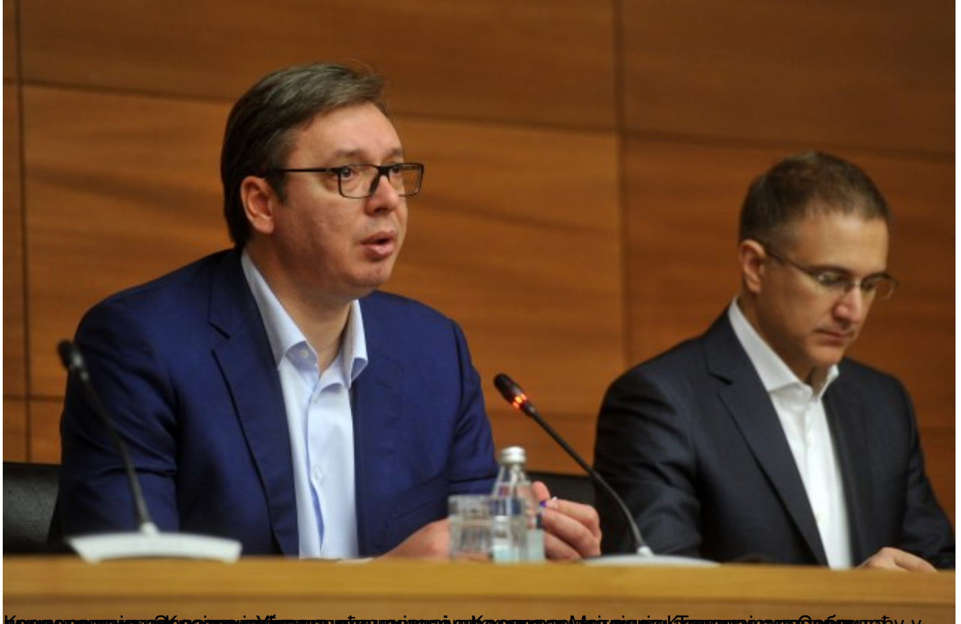
Кривошево је за Србију и Босну и Херцеговину једна од најважнијих тачака у односима са Западом и Европом. У Београду се налази и Београдски центар за демократију и правду.