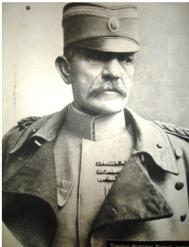
Генерал Животин Мишић, командант војних јединица које су ослобађале Београд

Пише: Из архиве НСПМ - Златко Богатиновски понедељак, 20 октобар 2014 12:12