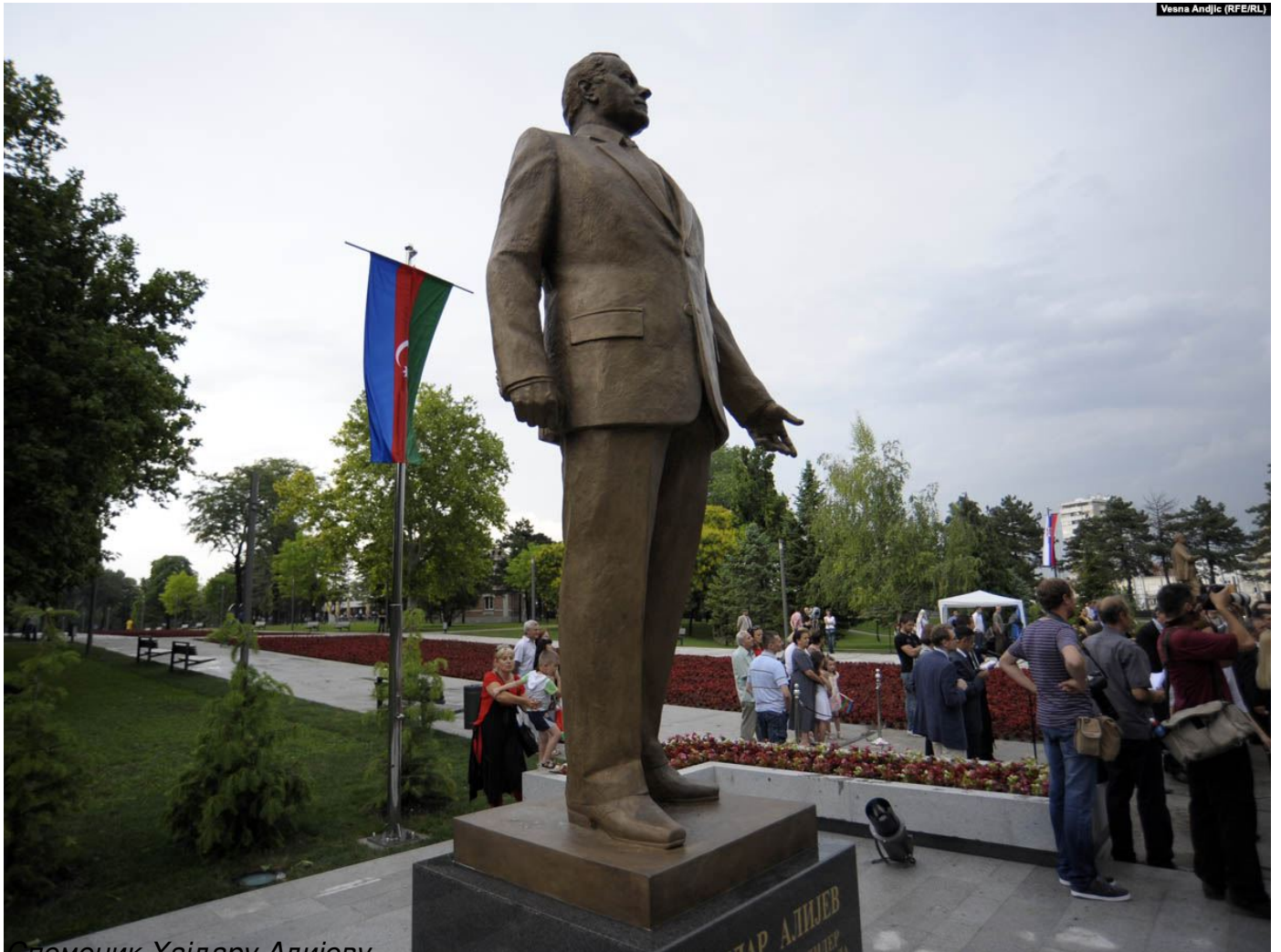
Споменик Хајдару Алијевићу