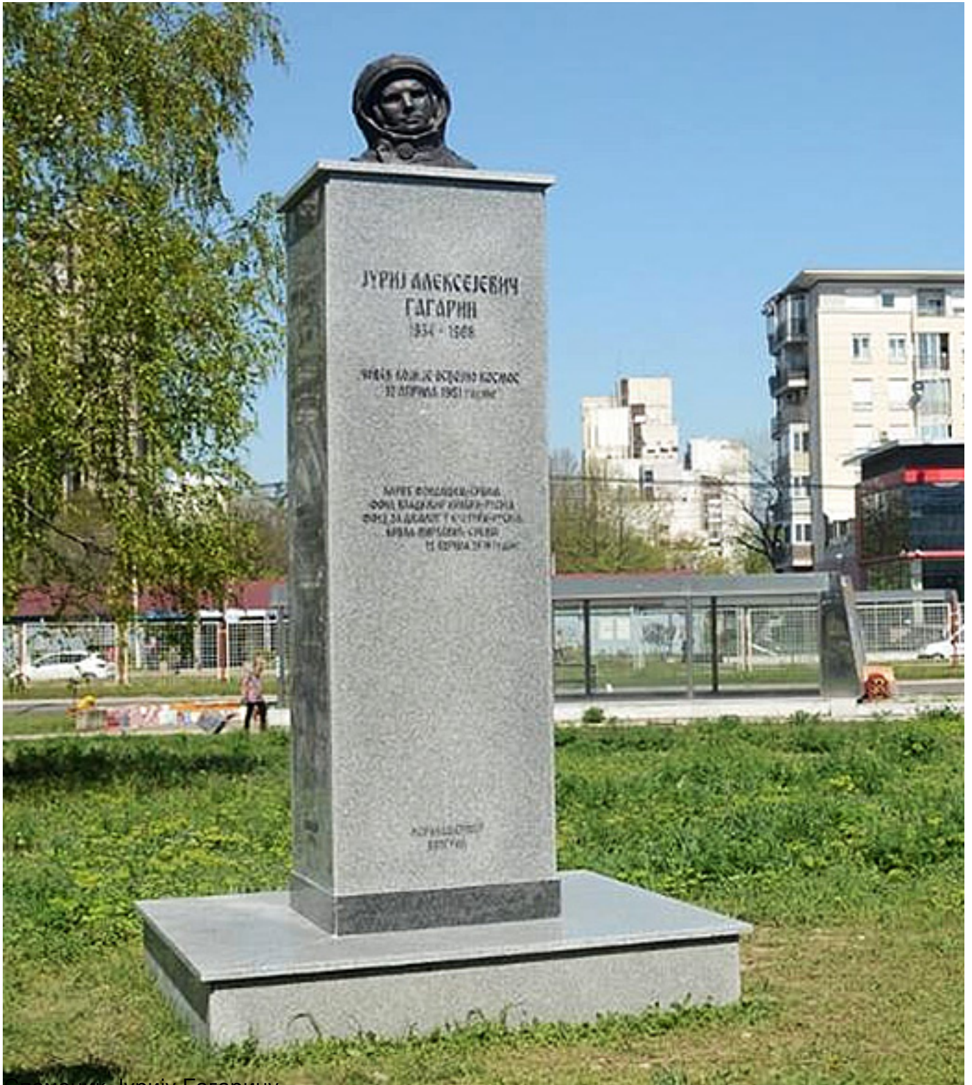
Споменик Јурију Гагарину