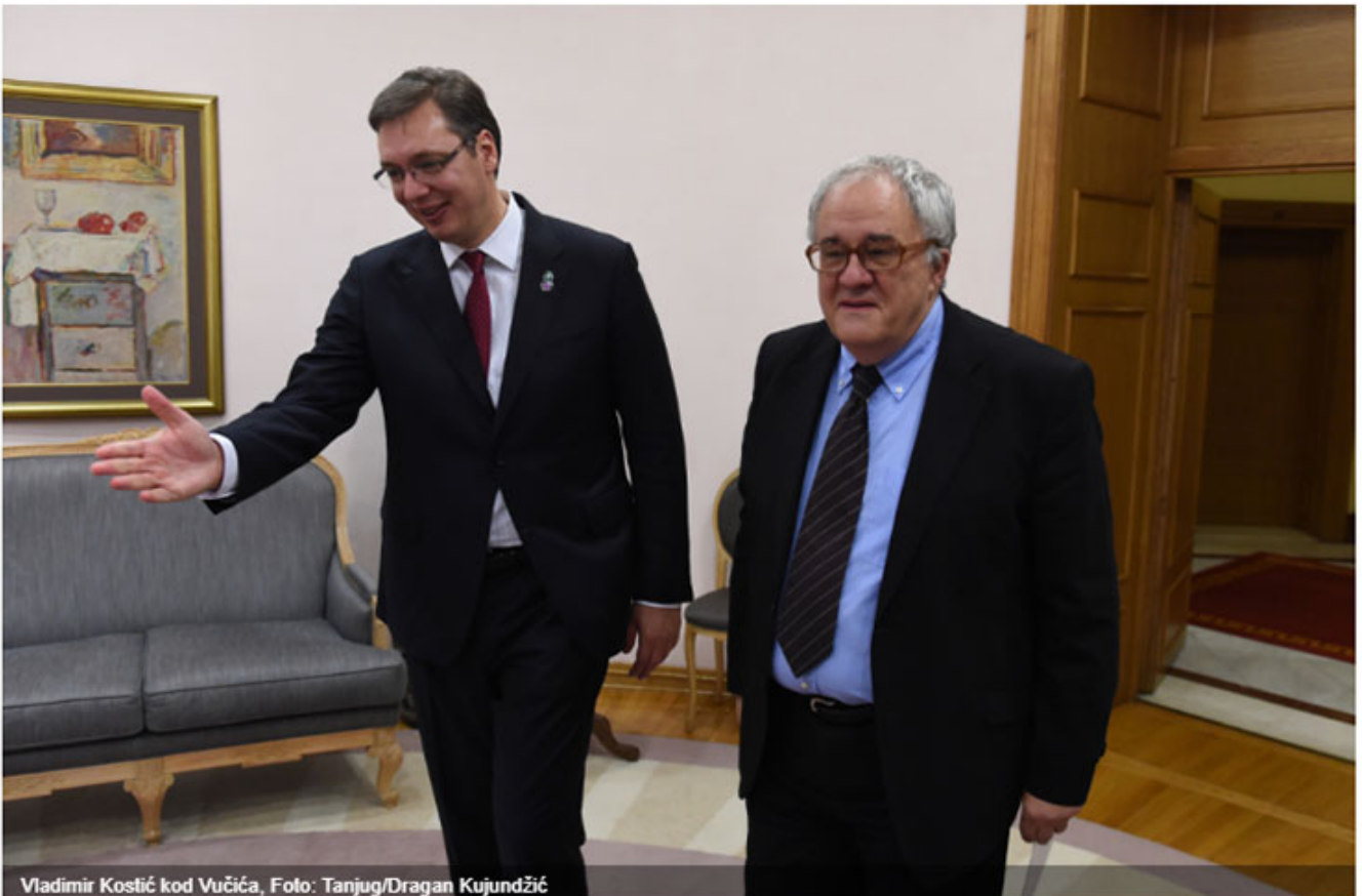
Vladimir Kostić kod Vučića

Premijer Srbije Aleksandar Vučić i predsednik Srpske akademije nauka i umetnosti Vladimir Kostić postigli su na sastanku konsenzus i razumevanje po pitanju daljeg rada SANU.