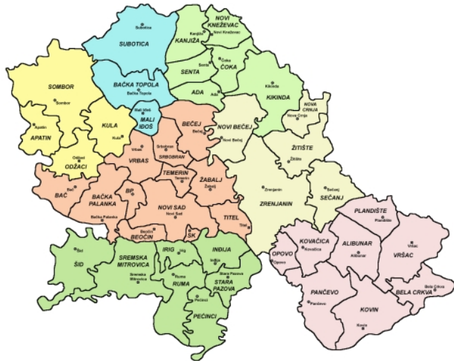
- Municipalities of Vojvodina / Општине Војводине -

Пише: Мирослав Самарџић среда, 18 април 2018 09:30