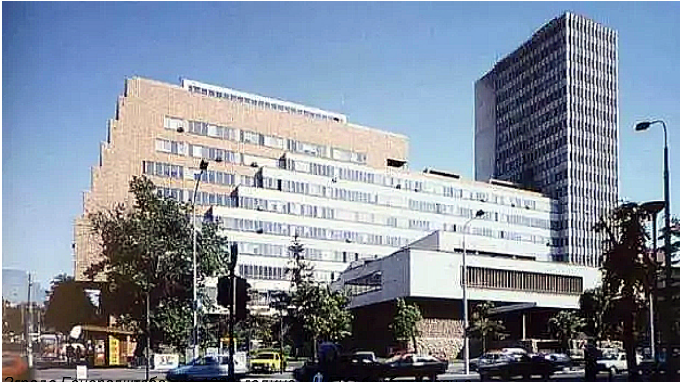
Зграде Генералштаба пре 1999. године и НАТО бомбардовања

Пише: Душко Кузовић понедељак, 25 март 2024 22:33