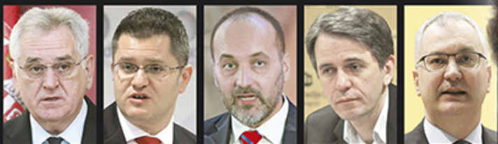
NA ISTOM ZADATKU Tomislav Nikolić, Vuk Jeremić, Saša Janković, Saša Radulović i Dragan Šutanovac

Istina je, svi su se ujedinili da mu skinu glavu