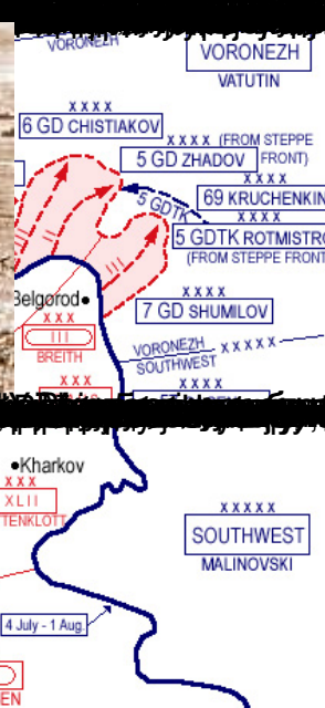
BATTLE OF KURSK 4 JULY - 1 AUGUST 1943