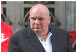
Субаше и испаше