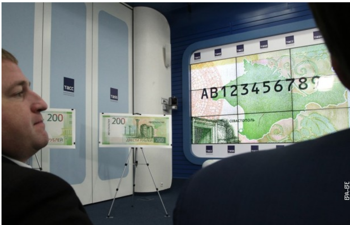
Крим на банкноти од 200 рубаља

Иако је у Русији избегнут економски колапс, западни ембарго условљава деградацију производних капацитета земље. Наиме, санкције искључују Русију из глобалних ланаца снабдевања у широком спектру кључних сектора. Последишно, дугорочна економска будућност Русије зависи од тога да ли ће Москва моћи брзо да произведе домаће алтернативе страном роби којој више нема приступ, или да набави аналоге из „пријатељских“ земаља као што је Кина. Тамо где ове две опције не успеју, остаје да се ослања на кријумчарење.