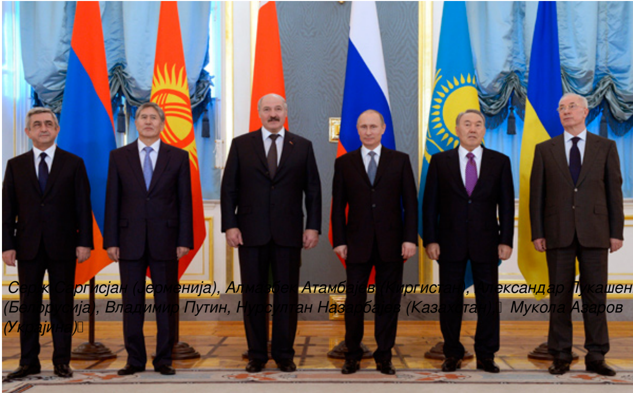
Серж Саргсијан (Јерменија), Алмазбек Атамбајев (Киргистан), Александар Лукашенко (Белорусија), Владимир Путин, Нурсултан Назарбајев (Казахстан) и Микола Азаров (Украјина)

присуствовали шефови држава Русије, Белорусије и Казахстана Владимир Путин, Александар Лукашенко и Нурсултан Назарбајев, председник Јерменије Серж Саргсијан, председник Киргистана Алмазбек Атамбајев и премијер Украјине Микола Азаров.