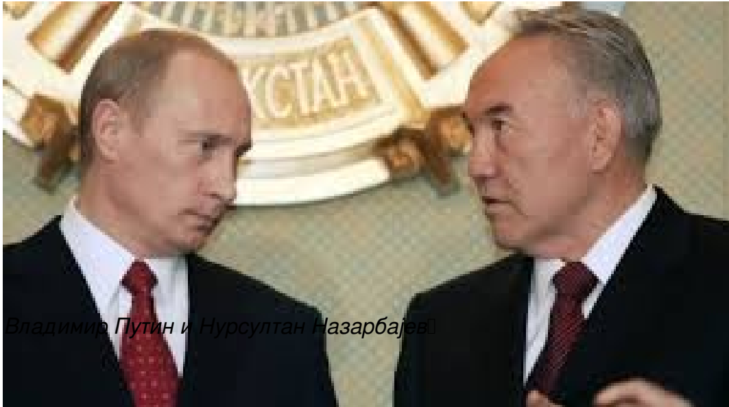
Владимир Путин и Нурсултан Назарбајев

Председник Казахстана Нурсултан Назарбајев је био снажно против било какве промене предвиђеног облика уније и инсистирао на искључењу свих одредби које излазе из оквира економских интеграција. Према Назарбајеву, области као што су безбедност граница и имиграциона политика, систем одбране и безбедности, здравља, образовања, науке, културе, правна помоћ нису важне за економске интеграције, а он је такође позвао да се осигура да споразум о економској унији не омета односе земаља учесница са другим државама и организацијама. У свом говору након састанка, Назарбајев је посебно истакао и да је политички суверенитет Русије, Белорусије и Казахстана "непроменљив".