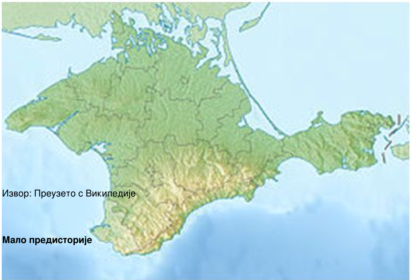
Слика 1. Кримско полуострво

Историја Крима и суживота различитих народа који га насељавају, укључујући и њихове међусобне сукобе, богата је и протеже се у давна времена. Плодна земља и повољна клима привлачиле су разне народе – Скити, Сармати, Грци, Римљани, Готи, Хуни и многи други. Међу њима и древни Русичи, који су на источном делу полуострва створили у периоду од 10. до 12. века снажно Тмутараканско кнежевство. Према у званичној историји прихваћеним ставовима, Татари су на Крим дошли с најездом Татаро-Монгола почев од 1223. године (напад на Судак), све док наредним нападима древна Таврика, како се некад називао Крим, није постала један од татарских улуса, тј. држава