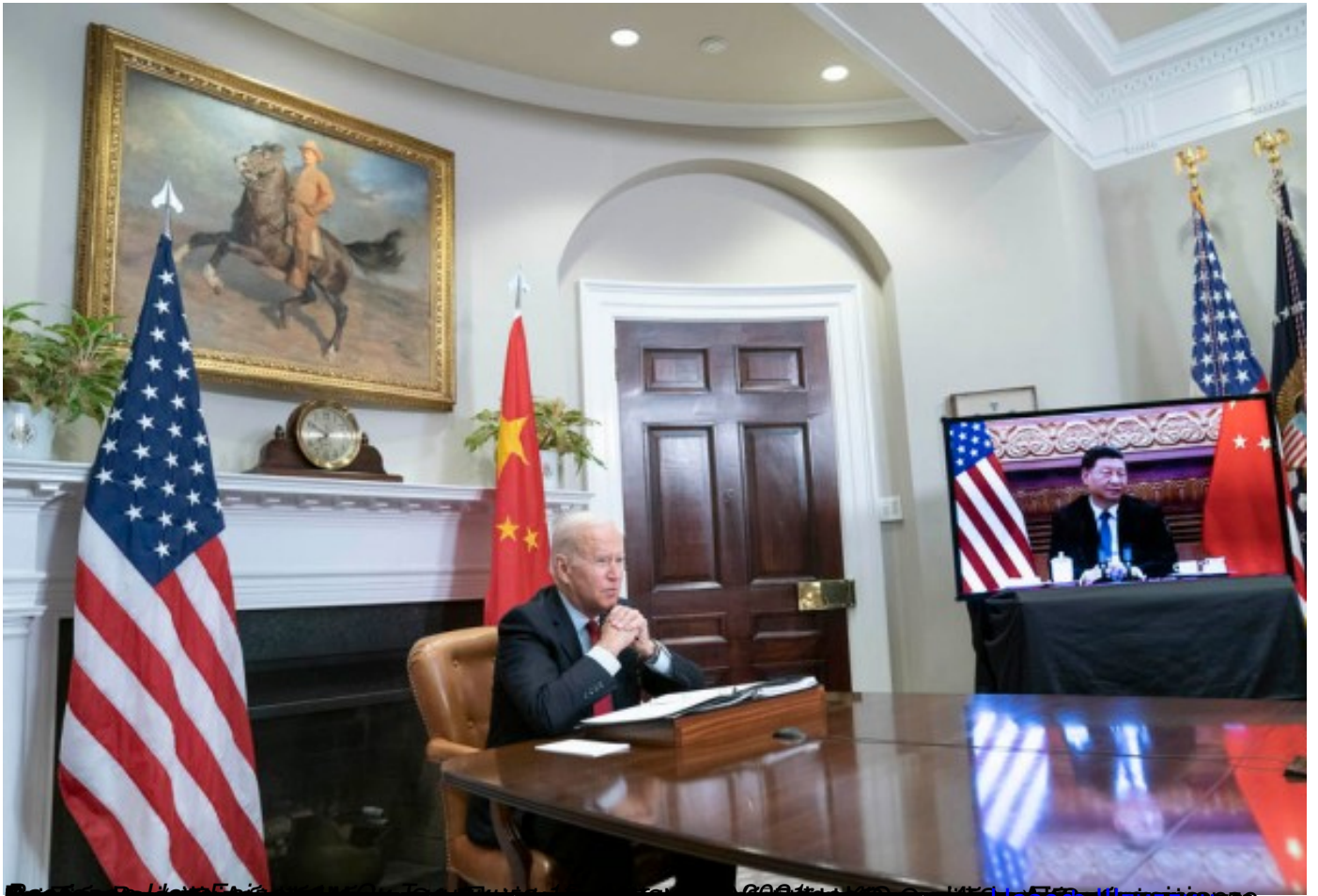
Џозеф Бајден и Ли Џацунг у видео састанку у Белој кући, 27. јуна 2022.

Пише: Горан Николић понедељак, 27 јун 2022 20:51