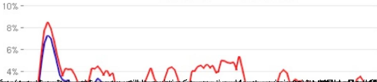
Real Median Household Income Index (Monthly Level) Through March 2012, Seasonally-Adjusted (www.SentierResearch.com)